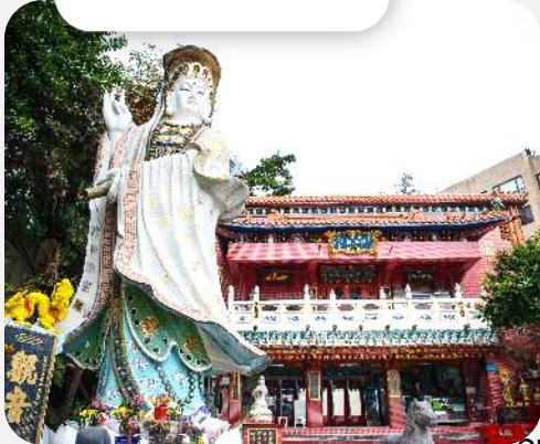
เยี่ยมชมสถานที่ 4 วัน 2 คืน Hong Kong Airlines (HX)

ฮ่องกง นองปิง รีพัลส์เบย์ วิกตอเรียพีก ดิสนีย์แลนด์ ไขว้พระ